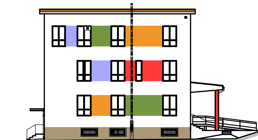
POHLED BOČNÝ - LAVÝ, JUŽNÝ