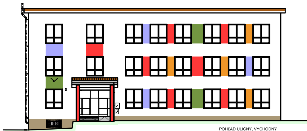
POHLED ULIČNÝ, VÝCHODNÝ